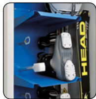
samostatné výduchy pre lyžiarky, rukavice a helmy

*v závislosti od nastavenia a teploty v miestnosti