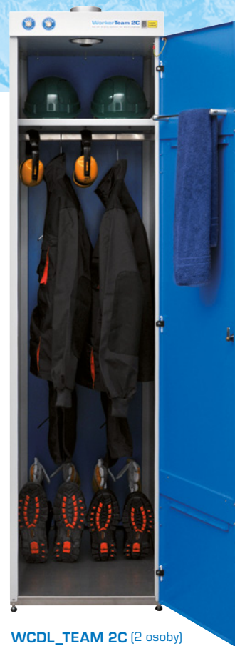
WCDL_TEAM 2C (2 osoby)